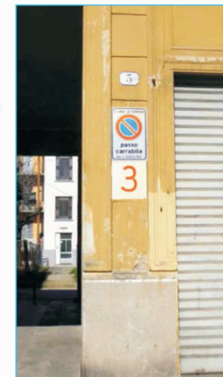
APPLICAZIONE NEL CONTESTO