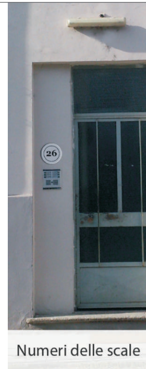
Numeri delle scale

Il progetto punta sulla semplicità e la pulizia delle forme. Un segno discreto, ma presente che limita l'intervento grafico all'essenziale per preservare la massima leggibilità e l'integrazione nel contesto esistente.